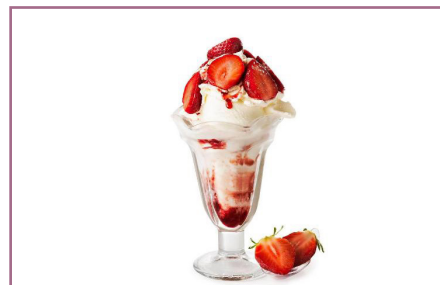
Nata con Fresas