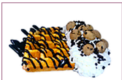
Gofre Chips Ahoy