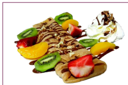
Crep de Frutas