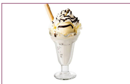
Dama de Blanco