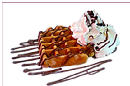
Gofre con Nata