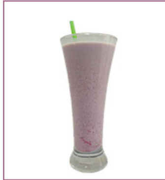
Frutas del Bosque