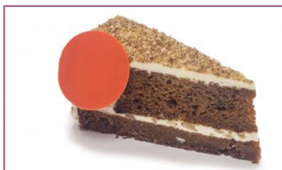
Tarta Carrot Cake