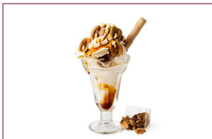
Nata con Nueces